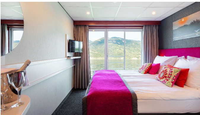
MS Nestroy, Doppelkabine Schiller- / Goethedeck