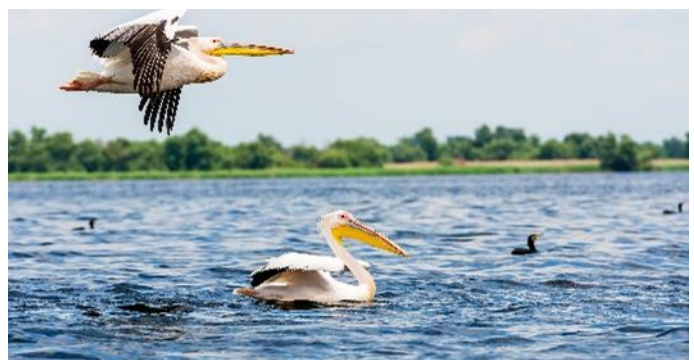
Pelikane im Donaudelta