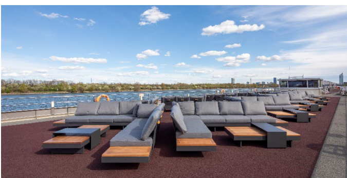
MS Nestroy, Lounge Sonnendeck