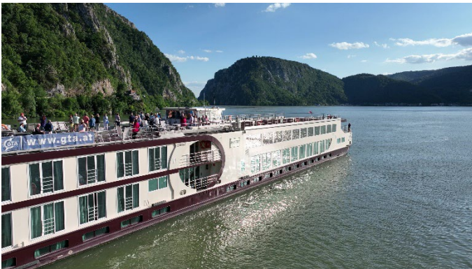
MS Nestroy im Eisernen Tor